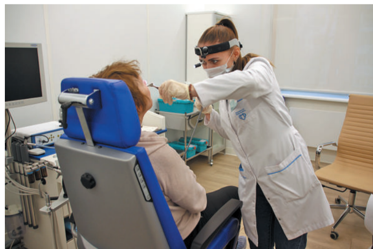
Во время ремонта специалисты филиала № 5 ведут прием жителей Нижегородского района в филиале № 1