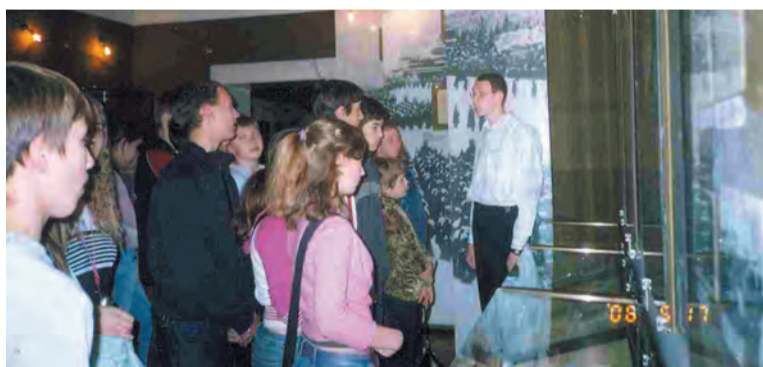
Экспозиция, посвященная В.В. Талалихину, в Ленино-Снегиревском мемориале

В одном из залов ордена Красной Звезды Центрального музея Вооруженных Сил установлен фюзеляж сбитого немецкого самолета. Рядом надпись: «Фашистский бомбардировщик «Хейнкель-111», уничтоженный московским летчиком-истребителем В.В. Талалихиным».