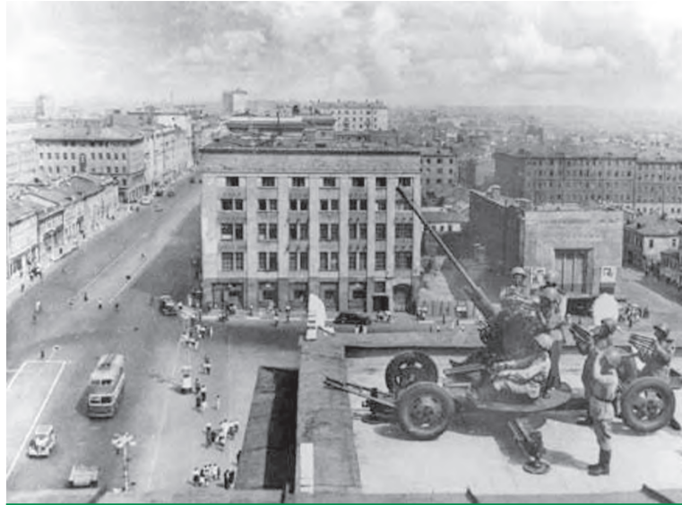
Войска ПВО на охране неба

До последнего патрона бились в воздушных схватках наши летчики-истребители. Они старались не пустить врага к Москве с его смертельным грузом. А когда при-