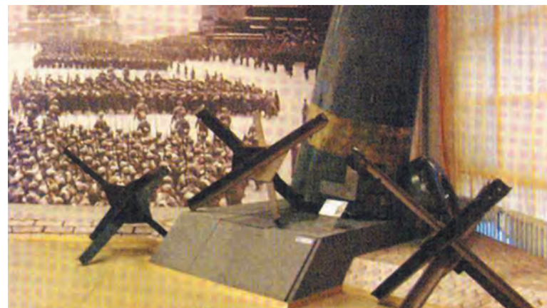
Фюзеляж сбитого немецкого самолета «Хейнкель-111» в Центральном музее Вооруженных Сил