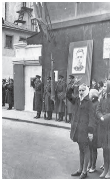
Открытие мемориальной доски в честь переименования улицы В.В. Талалихина в 1952 году

В 1952 году по решению Моссовета улица Мясная-Бульварная была переименована в улицу Талалихина. В память этого установлена мемориальная доска на доме № 2 по улице Талалихина. На здании управления Мясокомбината им А.И. Микояна (Михайловский проезд, д. 3) установлена мемориальная до-