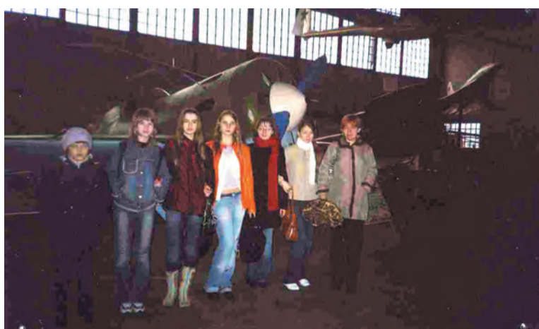
Экскурсия в Центральном музее ВВС России в г. Монино Московской области

Взгляд героя устремлен в небо, которое он защищал. Отважный летчик выполнил свою клятву: «По-