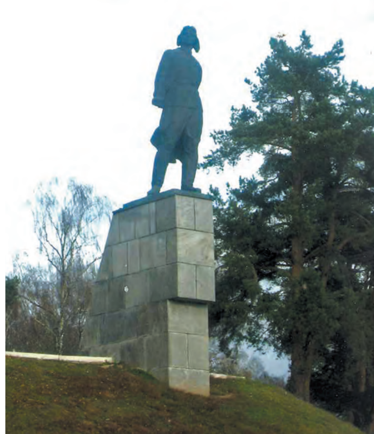
Памятник В.В. Талалихину в поселке Кузнечики

Не только благодарные москвичи помнят подвиг героя.