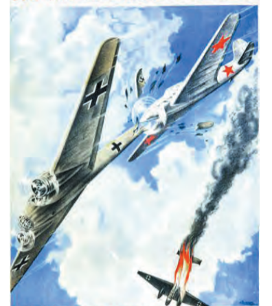
СЛАВА СТАЛИНСКИМ СОКОЛАМ – ГРОЗЕ ФАШИСТСКИХ СТЕРВЯТНИКОВ.

Плакаты времен Великой Отечественной войны