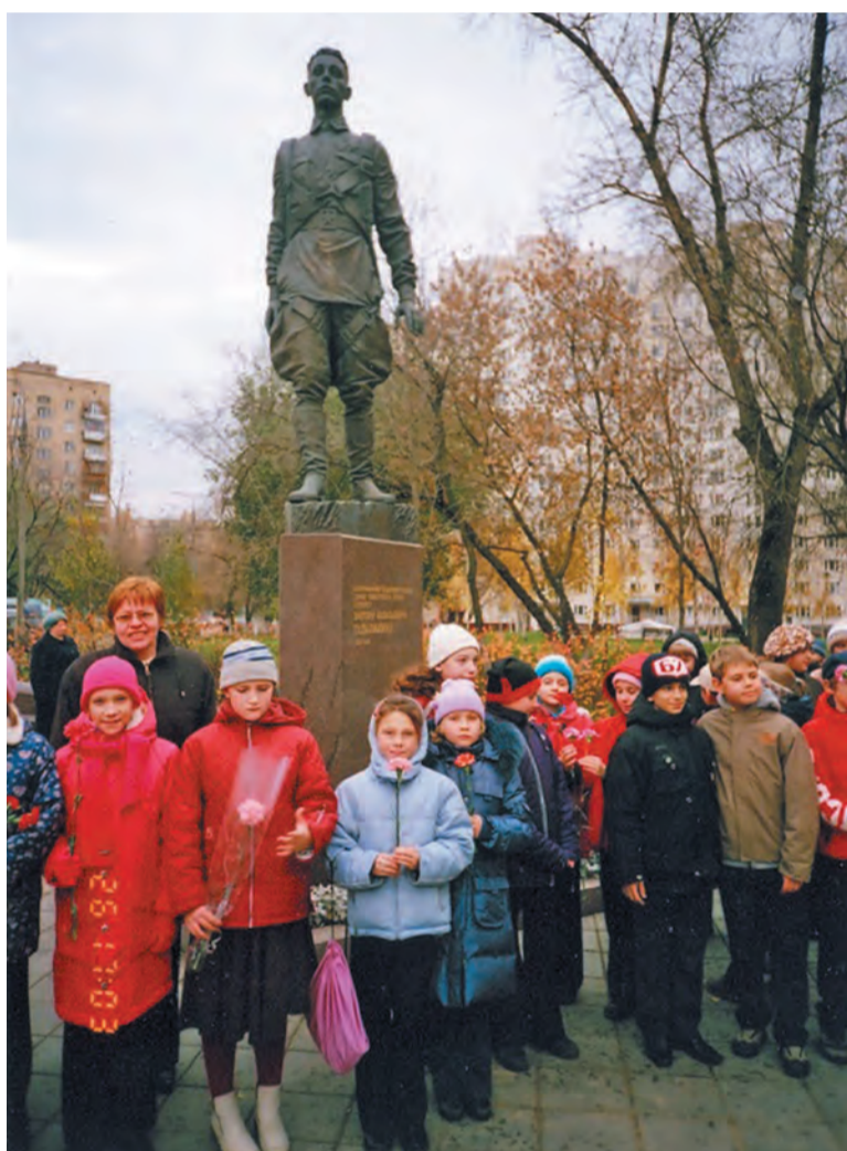
Возложение цветов к памятнику В.В. Талалихину в годовщину его гибели