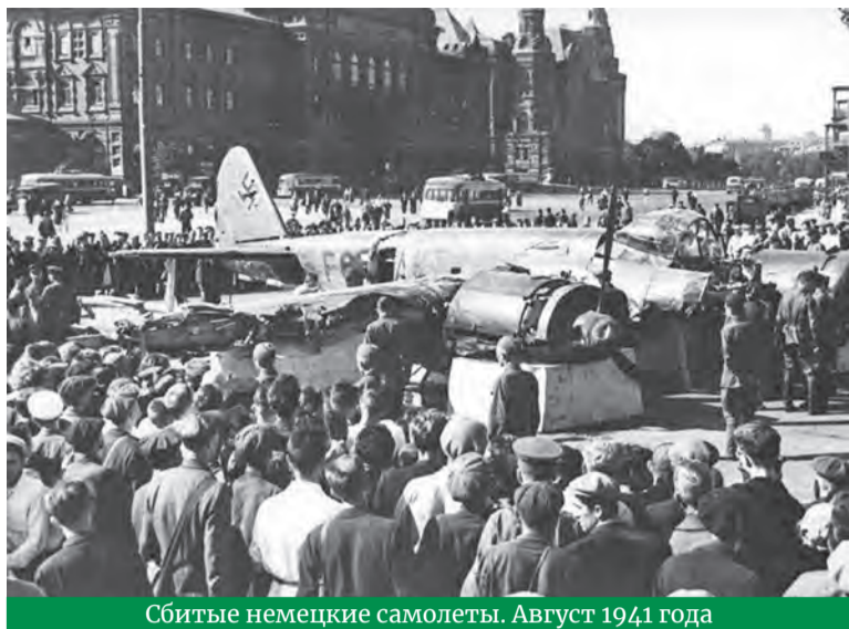
Сбитые немецкие самолеты. Август 1941 года

В августе 1941 года в ЦПКИО им. Горького все москвичи могли увидеть самолеты, сбитые советскими летчиками, в том числе и вражеский бомбардировщик, сбитый В. Талалихиным. После совершенного им подвига он был принят кандидатом в члены ВКП (б). В последующих боях он уничтожил еще пять самолетов противника.