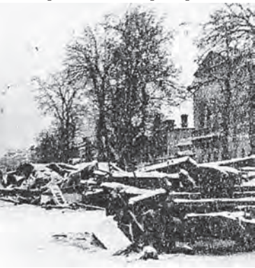
Храм Живоначальной Троицы в Карачарове, 1941 год

Но вот начинается Великая Отечественная война. Завод «Стальмост» переводит своё производство на военные рельсы. Начинается выпуск продукции для удовлетворения потребностей фронта и, особенно, обороны Москвы. «Всё для фронта! Всё для Победы!» – под таким девизом в цехах завода ремонтировались бронированные