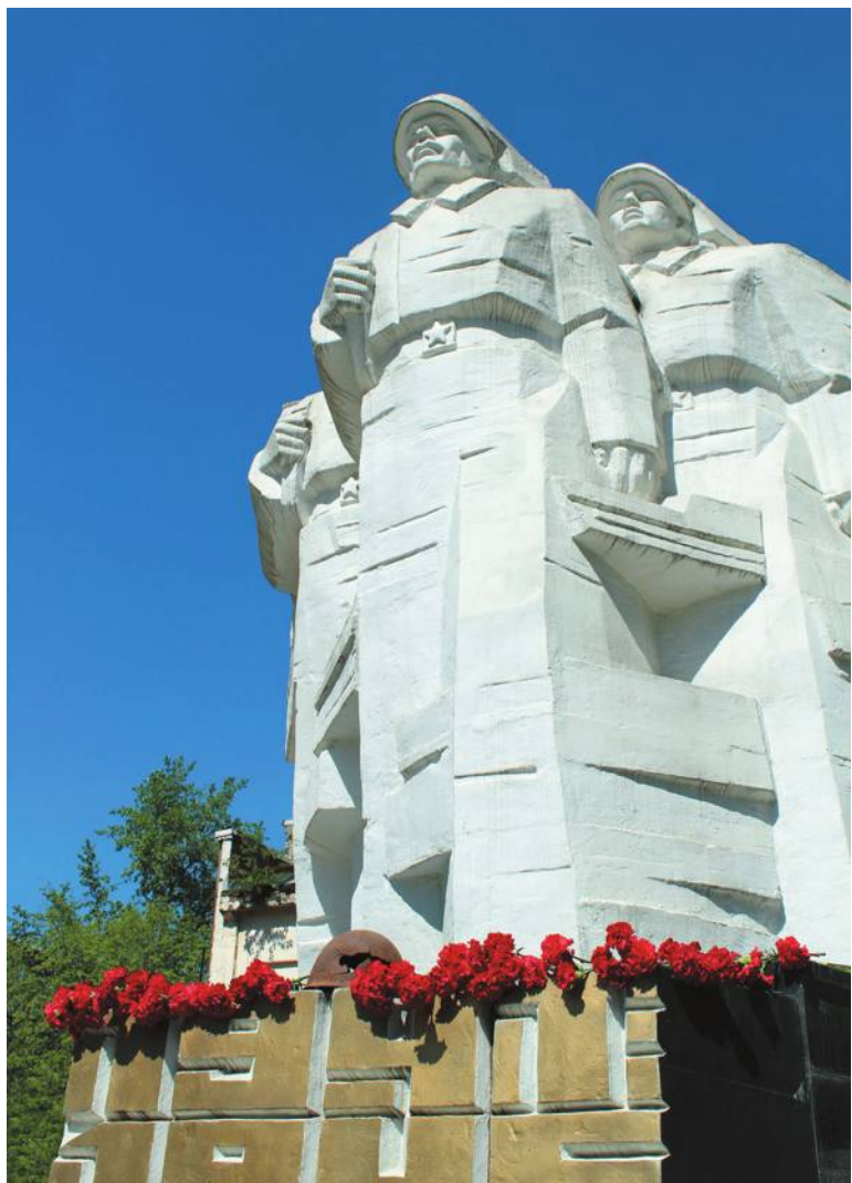
Памятник погибшим в годы Великой Отечественной войны сотрудникам Первого московского колбасного завода (в настоящий момент Микояновский мясокомбинат)